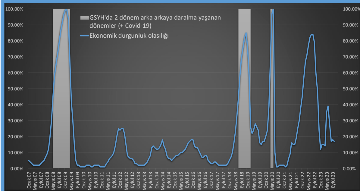
Şekil 2. Ekim 2023 itibariyle hesaplanan ekonomik durgunluğa girme olasılıkları

EDE ve FDE'nin ortak hareketlerinden yola çıkarak kısa vadede ekonominin durgunluğa girme olasılığını hesaplıyoruz. Şekil 2'de bu olasılıkların 2007'den günümüze kadar dönemdeki değişimi gösterilmektedir. Bu ay bu olasılığı %17 hesapladık.